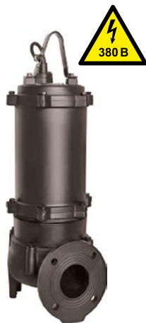
Модель 65КПН 25-20-3

Канализационные погружные насосы JEMIX серии КПН предназначены для откачивания канализационных, дренажных, дождевых, грунтовых вод и подобных не агрессивных жидкостей в том числе включающие фекалии.