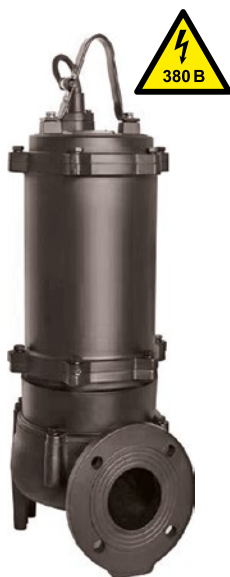
Модель 65КПН 30-30-5,5