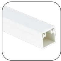
Двойной замок – легкое открытие/закрытие