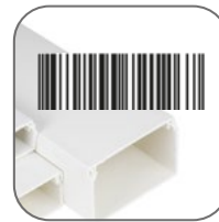
Система штрих-кодов – удобство хранения и реализации