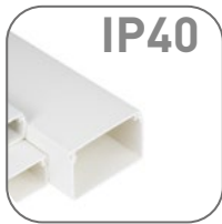
Степень защиты IP40